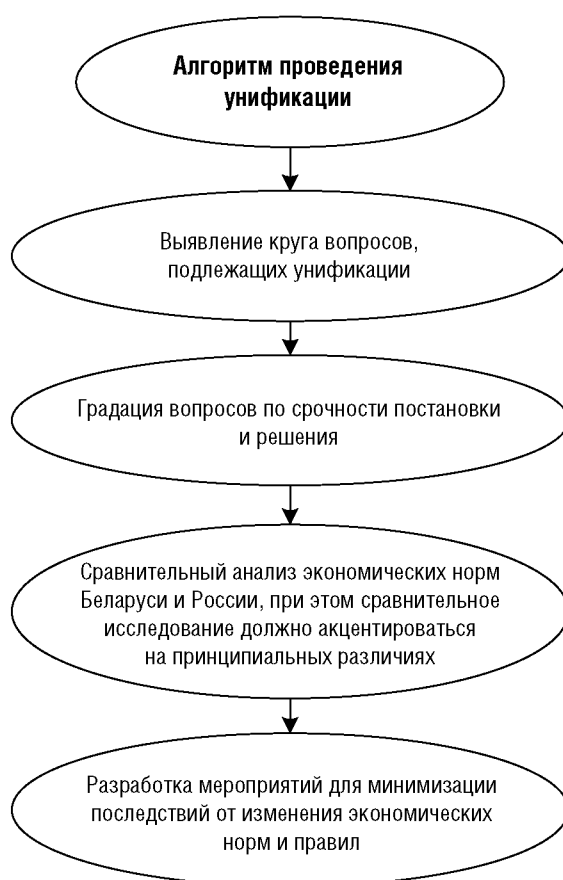
Рисунок 4. Алгоритм проведения унификации